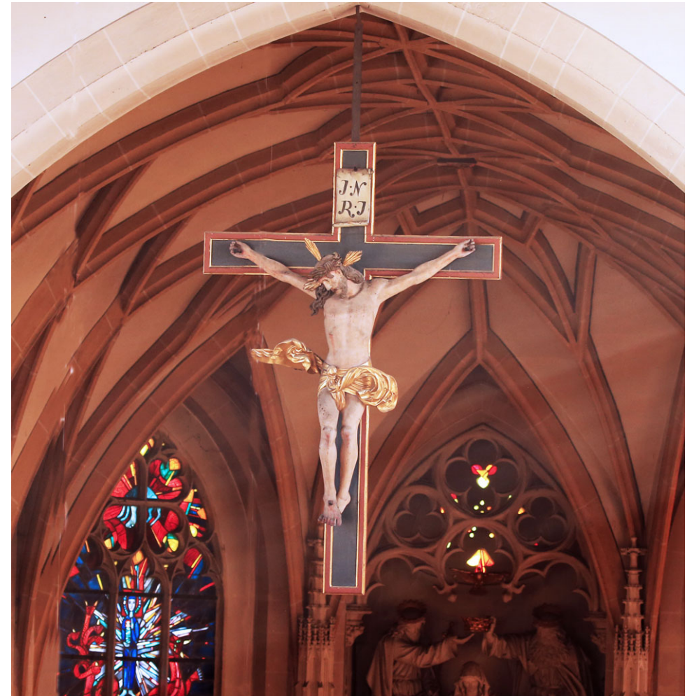
Foto Kreuz im Chorbogen der Stadtpfarrkirche

Im Licht des Kreuzes erstrahlt die Welt!