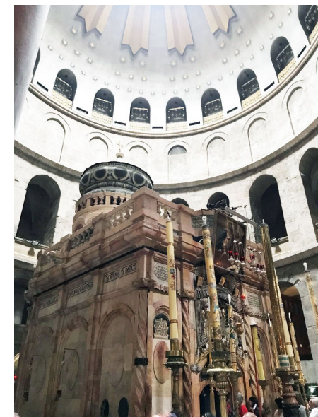
Heiliges Grab unter der Kuppel der Anastasis, der Grabes- und Auferstehungskirche in Jerusalem

Mit diesem Wissen wurde auf den Befehl Helenas, die ihr Sohn Konstantin zur Augusta (Kaiserin) erhob, das Forum Hadrians abgetragen